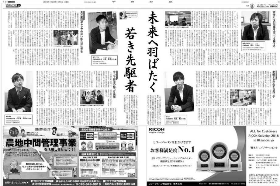
とちぎアントレプレナーコンテスト受賞者たち

『とちぎアントレプレナー・コンテスト』は、2013年から開催しています。今までに県内高校・大学など82校からのべ4,631件エントリー7組の社長を輩出しています。実行委員は地元起業家様の有志により活動をしてまいりました。現在では、県内市町様から後援もいただき今年第8回目を迎えます。今後もさらに次代を担う人材育成のためのプログラム継続推進を図り、大きな希望をもって社会に出る学生を一人でも多く輩出するために皆様のお力添えをいただきたい所存でございます。コンテスト期間中において、学生と直接関わりを持てる機会も多数ございます。県内の学生に向けて有意義な情報発信の場としてもご活用いただければ幸いです。つきましては活動の趣旨をご理解いただき、ご協賛くださいますようお願い申し上げます。