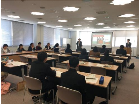
①選考通過者対象セミナー