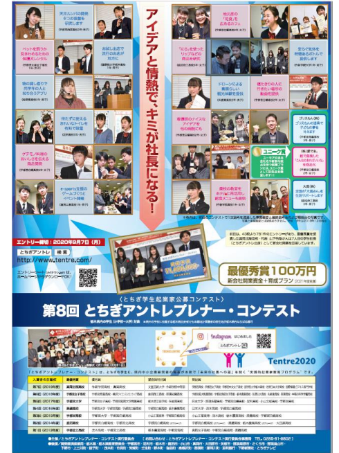
第8回とちぎアントレA4チラン