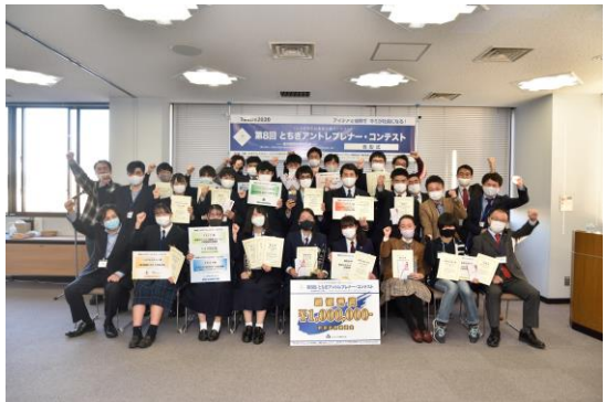
④ファイナリスト集合写真